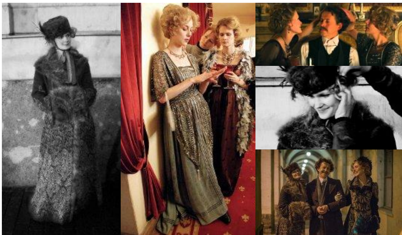
Filme „Laiškai Sofijai” (rež. Robertas Mullanas)