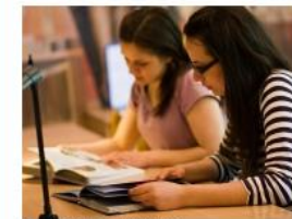
PRIĖMIMO TVARKA INFORMACIJA... Skaityti toliau