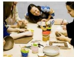
Pasimatuk profesiją: profesinis mokymas gyvai ir kūrybiškai!