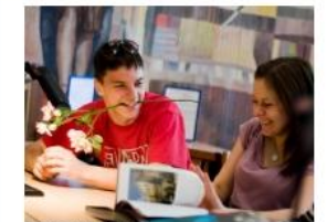
SPECIALYBĖS SPECIALYBIŲ SĄRAŠAS (norėdami sužinoti daugiau spauskite ant pasirinktos...)