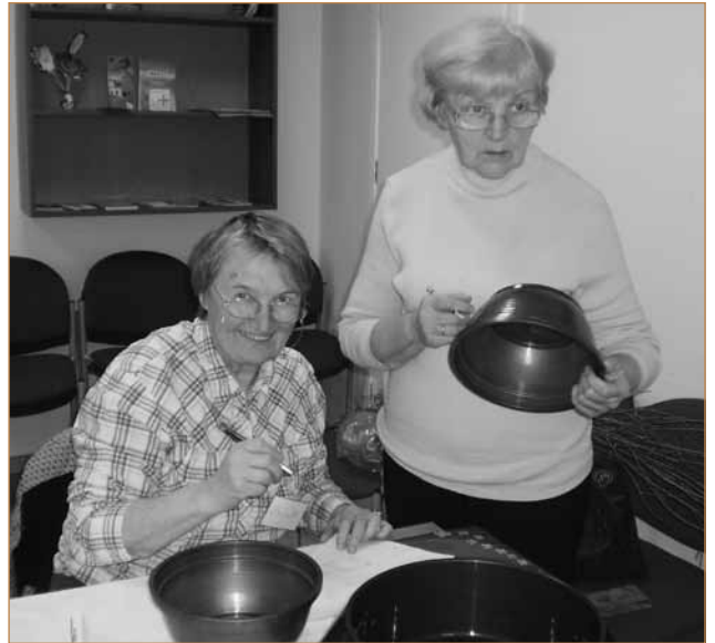
Ekologinės žemdirbystės mokymai Telšių savivaldybėje