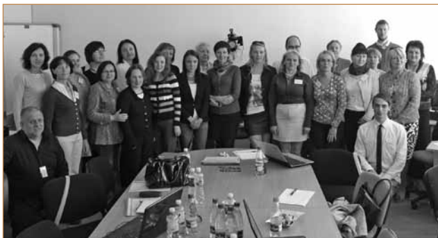
Andragogų mokymai Kaune

Prasidėjus vasarai organizuoti projekto „Suaugusiųjų švietimo sistemos plėtra suteikiant besimokantiems asmenims bendrąsias kompetencijas (II etapas)“ mokymai, skirti trečiojo amžiaus