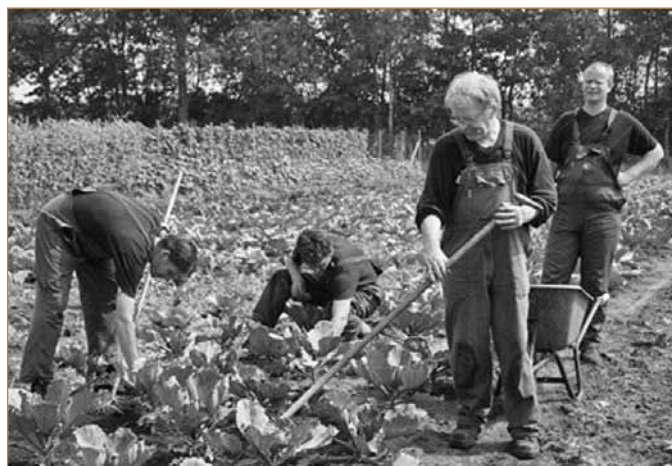
Organizacijos „Surplus“ patirtis

pailsėti ar organizuoti įvairias šventes, pavyzdžiui, įmonės vakarėlius, gimtadienius. Be to, svečiai veikiančiame ūkyje gali patys žvejoti, rinkti auginamas daržoves ar vaisius.