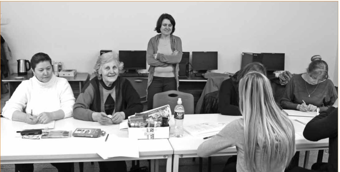
Meninės raiškos mokymai Elektrėnuose