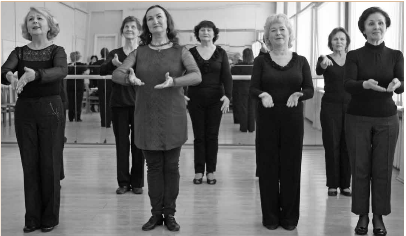
Šokių pamokos Marijampolėje

Mokymai vyko įgyvendinant Ugdyto plėtotos centro projektą „Suaugusiųjų švietimo sistemos plėtra suteikiant besimokantiems asmenims bendrąsias kompetencijas (II etapas)“.