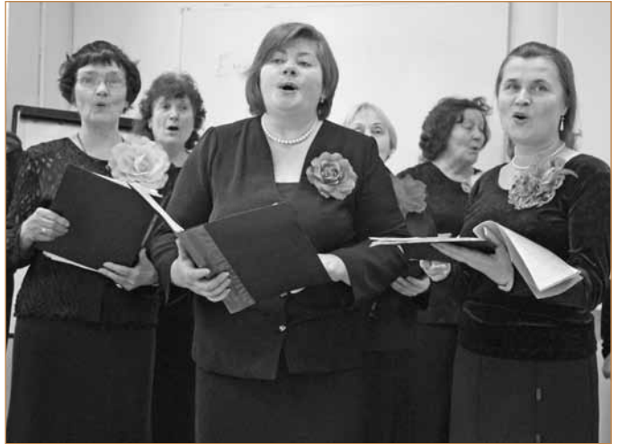
Dainavimo mokymasis Marijampolėje