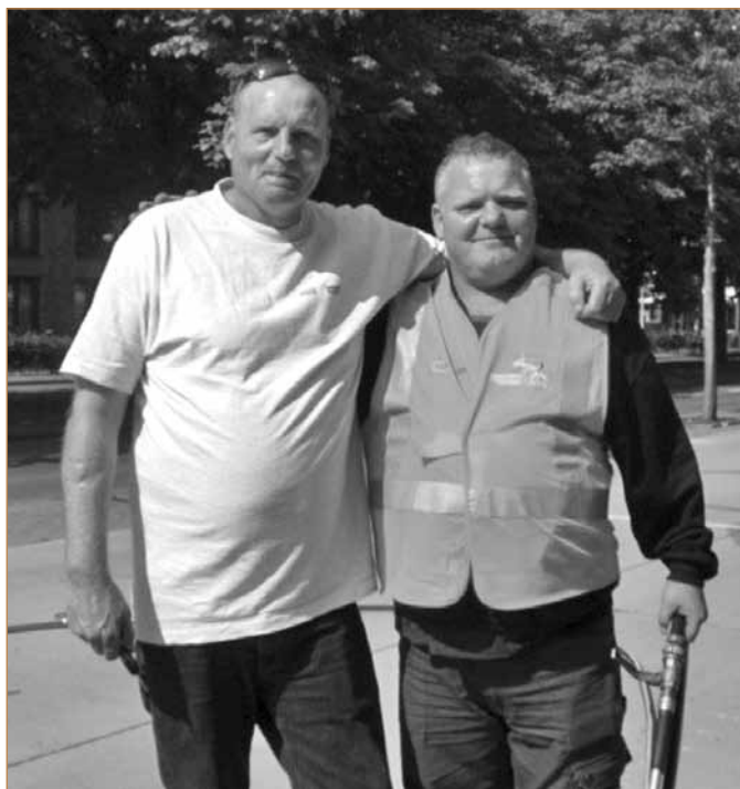
Organizacijos „Surplus“ patirtis

Fonde dirbantys specialistai yra nustatę dažniausius atvejus, kai žmonės ieško darbo. Atitinkamai, nustatyta, kokios priemonės jiems padeda susirasti darbą.