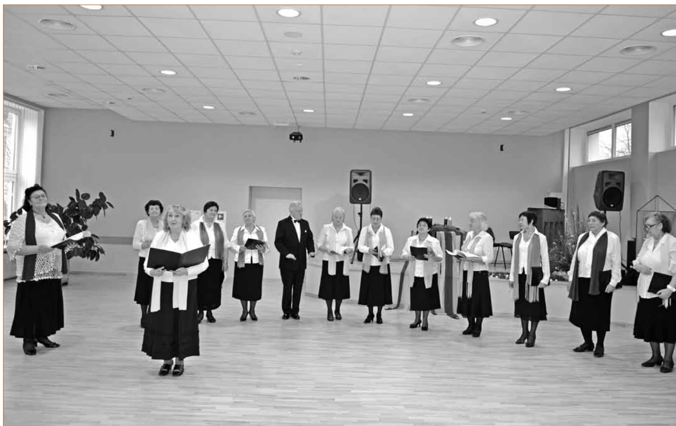
Dainavimo mokymasis Kretingoje