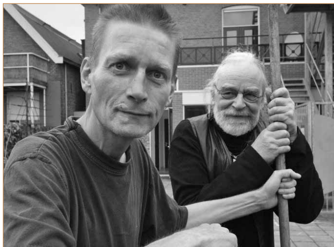
Organizacijos „Surplus“ patirtis

Upėtakių ūkio lankytojai ne tik gali pavalgyti restorane, įsigyti šviežios ar rūkytos žuvies, tačiau ir pasilikti ilgiau