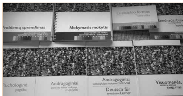
Parodoje pristatomi leidiniai