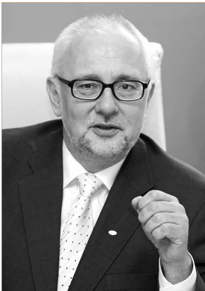
Prof. dr. Dainius Pavalkis Švietimo ir mokslo ministras