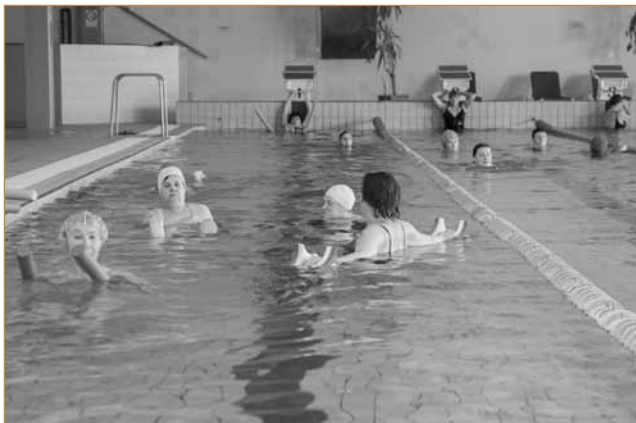
Baigėsi TAU mokymai: Anykščių rajone vyko sveikatingumo mokymai baseine

Tai – judesio menas (įvairių stilių šokiai); dainavimas arba muzikavimas; kūno sveikatinimas; vaizduojamasis menas (piešimas, medijos, dekupažas, kt.); želdinių dizainas ir ekologinė žemdirbystė). Šių mokymų tikslas – sudaryti galimybes trečiojo amžiaus