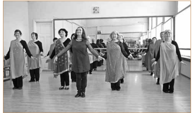
Mokymų uždarymas Marijampolėje

Mokymai vyko įgyvendinant Ugdymo plėtotės centro projektą „Suaugusiųjų švietimo sistemos plėtra sutei-