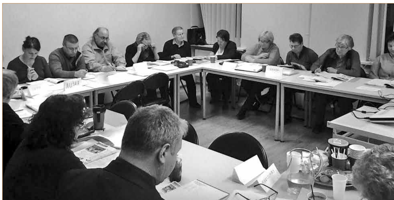
Anglų kalbos mokymai Biržuose