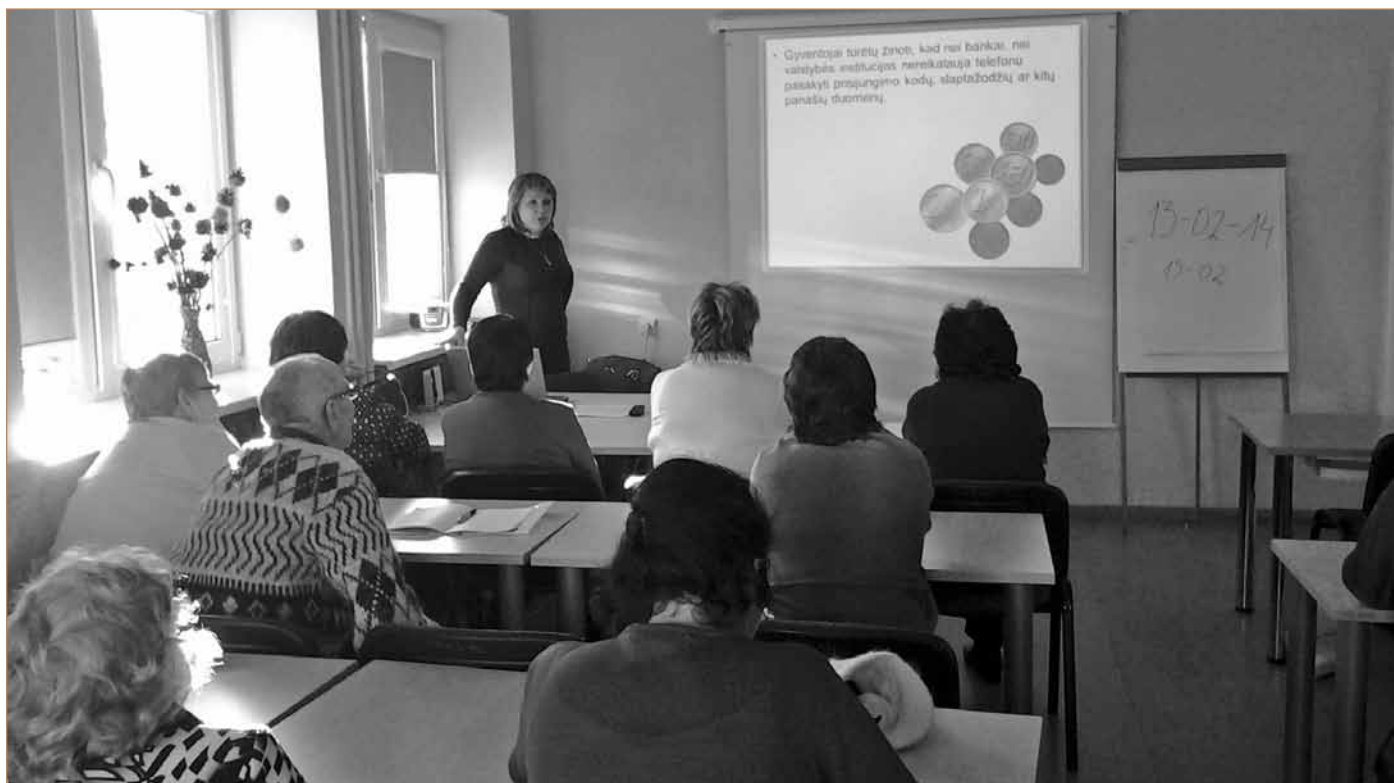
Akimirka iš „Finansinio suaugusiųjų švietimo“ mokymų

Kupiškyje gyvenanti moteris sako, kad dirbdama ji mokosi su jos darbo specifika susijusių dalykų, o šiuose