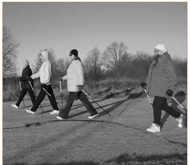
Mažeikių rajone išbandytas vaikščiojimas su šiaurietiškosiomis lazdomis

asmenims įgyti saviraiškos ir meninių gebėjimų kompetencijų.