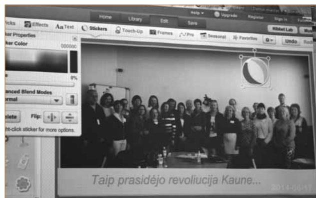
Androgogai išbandė inovatyvius mokymo būdus

Mokymų dalyviai ne tik klausėsi teorinių paskaitų, bet ir patys dirbo komandose, daug diskutavo ir kūrė praktinius planus.