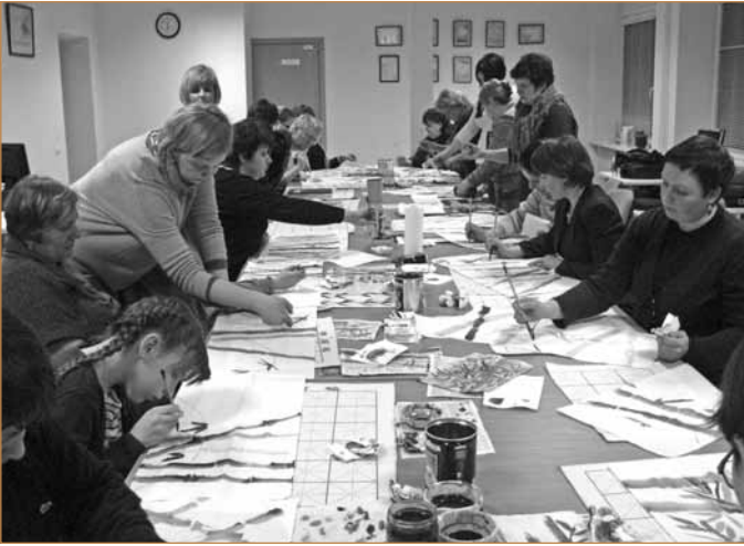
Meninis ugdymas Zarasuose