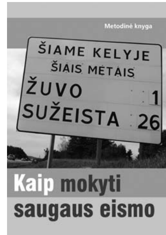
Metodinės knygos „Kaip mokyti saugaus eismo“ viršelis

Komplektas išleistas bendromis Policijos departamento Eismo priežiūros tarnybos, Švietimo ir mokslo ministerijos ir Lietuvos suaugusiųjų švietimo ir informavimo centro pastangomis, reaguojant į kasdienį „karą keliuose“.