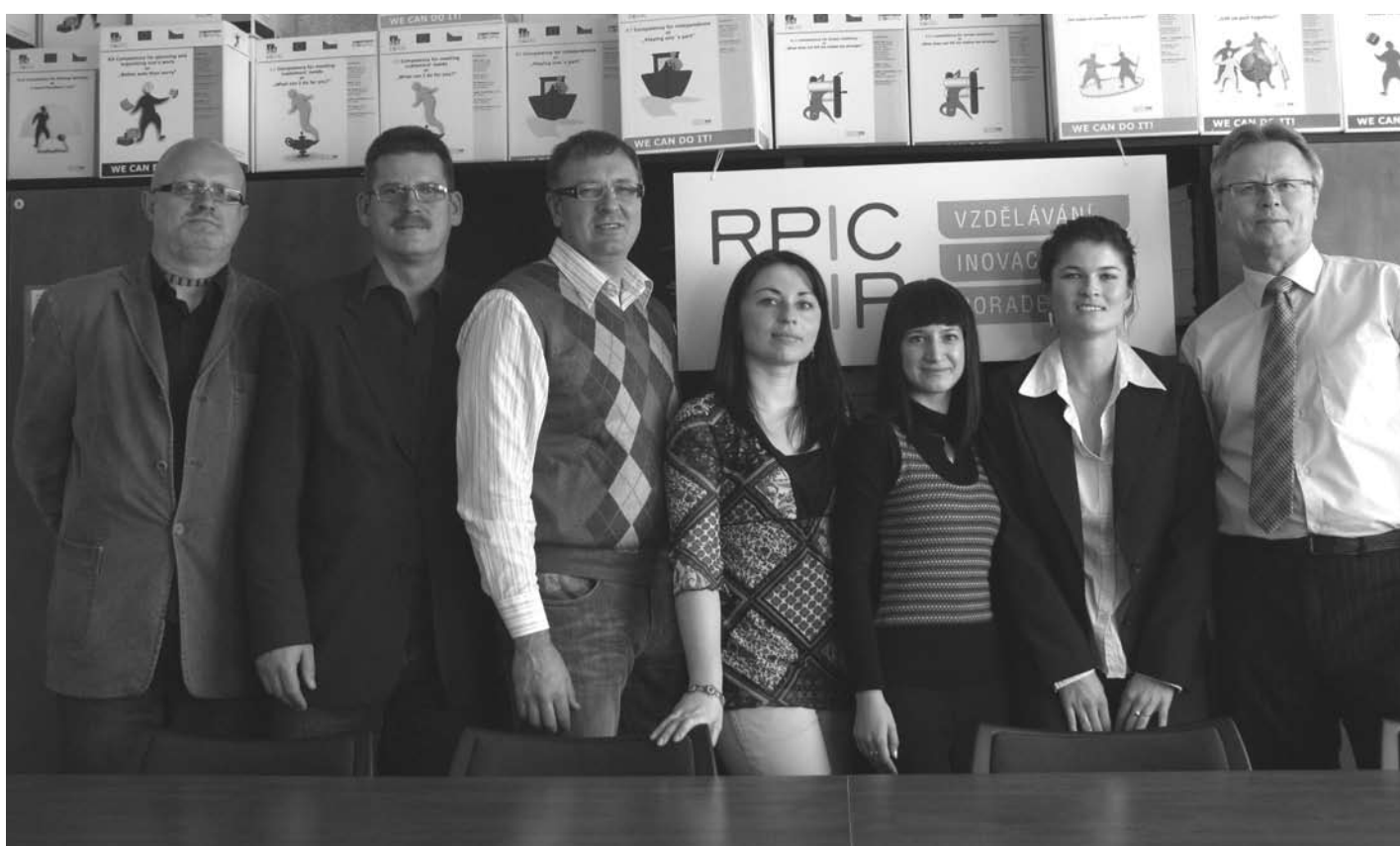
Lietuvos ir Čekijos ekspertų susitikimas

Numatoma ir ateityje plėtoti Lietuvos ir Čekijos bendradarbiavimą šioje srityje.