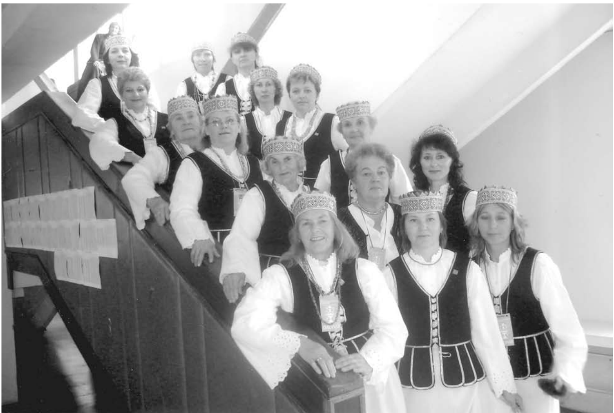
„Neskaičiuojam, kiek dainų mokam...“