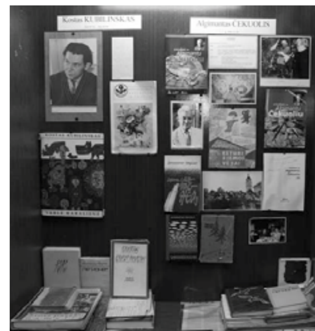
Vilniaus „Varpo“ suaugusiųjų mokyklos buvusių mokinių – įžymybių muziejus