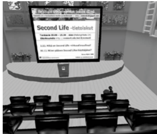
Viešnage virtualiame Joensuu universitete

Yra ir mokamų kursų, už kuriuos galima susimokėti specialia second life valiuta - Linden doleriais.