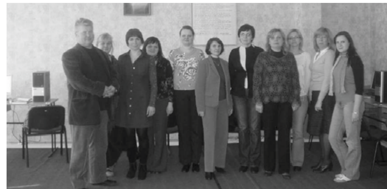
Vilniaus Gabrielės Petkevičaitės-Bitės suaugusiųjų mokymo centro kolektyvas

Laikui bėgant mokymo centras plėtėsi, atsirado vis daugiau suaugusiųjų, norinčių mokytis ir gilinti savo žinias ir nuosekliau mokymosi būdu. Siekiant sudaryti „antrąją galimybę“ suaugusiems asmenims įgyti pradinį, pagrindinį ir vidurinį išsilavinimą, plėtoti jų bendrąsias kompetencijas ir didinti mokymosi visą gyvenimą paslaugų prieinamumą, buvo atidarytos bendrojo lavinimo klasės.