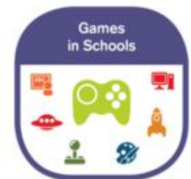
Games in Schools Teacher