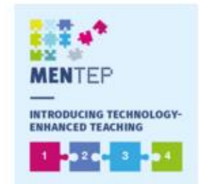
Introducing Technology-Enhanced Teaching Course - Course Badge