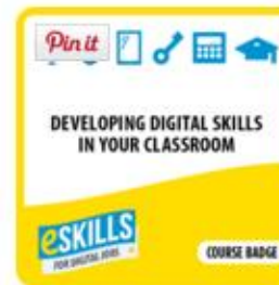
Developing Digital Skills in your Classroom Course