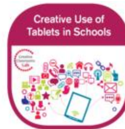
Creative use of Tablets in Schools