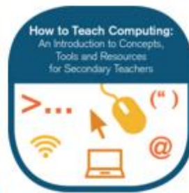
How to teach Computing Course Badge