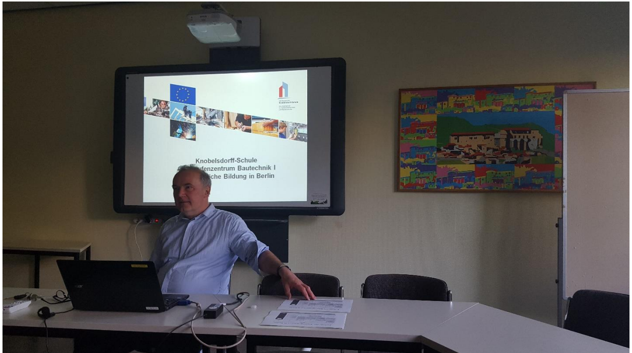
Susitikimas Knobelsdorff-Schule Oberstufenzentrum Bautechnik I