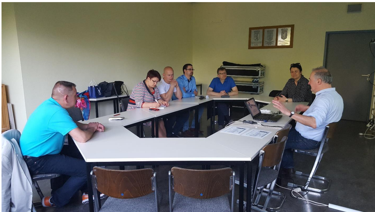
Susitikimas Knobelsdorff-Schule Oberstufenzentrum Bautechnik I

Tikima, kad stažuotės metu dalyvių įgytos žinios padės efektyvinti profesinio mokymosi procesą.